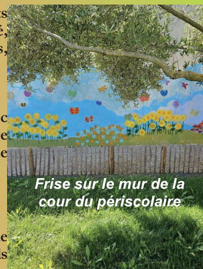
Frise sur le mur de la cour du périscolaire

Le mot de la commune : Grâce à la mutualisation de ces espaces modernisés, Beaugeay renforce son attractivité et réaffirme son engagement fort en direction des familles et des professionnels de l'enfance.