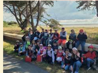
Après le pique-nique : photo de classe des CM2

Article rédigé par Chloé, Nolan, Sacha et Allan CM2