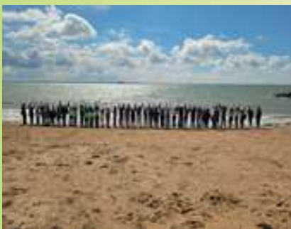
Les élèves de CM1 et CM2 sur la plage face à Fort Boyard !

Mardi 5 mai les classes de CM2 et CM1 ont passé la journée sur l'île d'Aix. Nous avons pris le bateau « La fée des îles » et nous avons fait le tour du Fort Boyard.