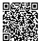
L'Hermione: Messagère secrète du Marquis de La Fayette: extrait de l'odyssée écrite par les CM2 de l'école Jean Bouchet de Beaugeay