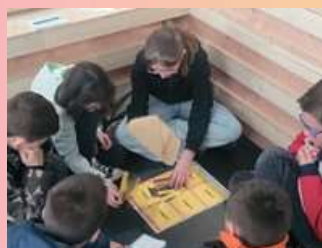
Découverte des métiers de l'Arsenal de Rochefort sous forme d'énigme