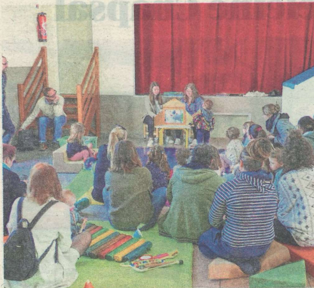
Deux animatrices capturent l'attention lors d'un temps d'histoires animées de style Kamishibai.

Au programme, une multitude d'ateliers captivants : jeux de construction, espace sensoriel, baby gym et même des histoires animées grâce à la technique Kamishibai, ce conte traditionnel japonais qui enchante petits et grands sur des images qui défilent dans un butai (théâtre en bois). Les trois crèches du territoire ont également