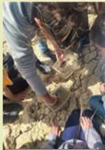
Le résultat de la pêche