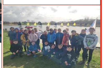
Toute la classe avant une séance sur le lac des Rouches