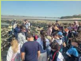
Pêche à pied sur la passe aux filles