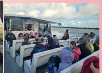
Le bateau : direction l'île d'Aix