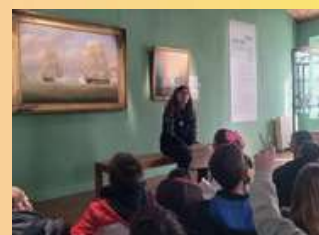
L'animatrice nous explique la bataille de Louisbourg