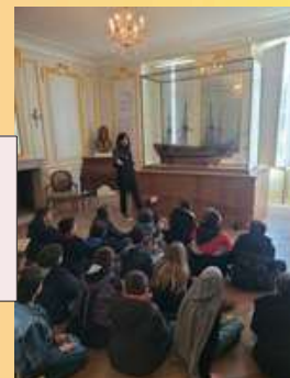
Maquette d'un vaisseau plus grand navire que la frégate